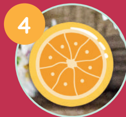
UN DRÔLE DE MACARON